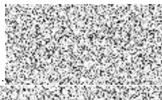
předsedkyně Svazu postižených civilizačními chorobami v ČR, z.s. Základní organizace Nymburk

Svaz postižených civilizačními chorobami v ČR z.s. základní organizace Nymburk